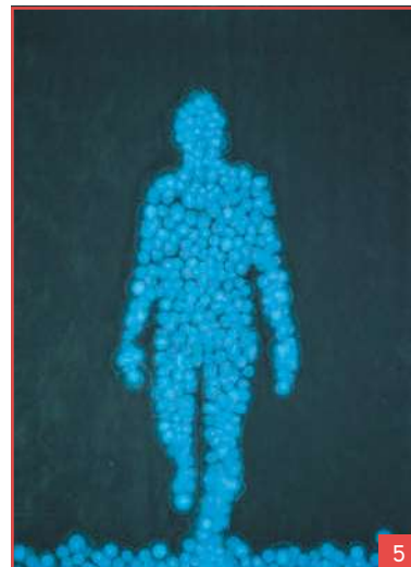
Matteo Montani, Unfolding (2017) matteo_montani_painting