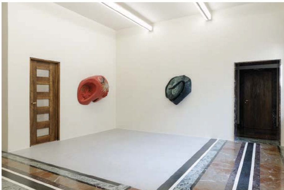
Come prima, meglio di prima, veduta della mostra, 2020.

dare vita a una sintesi che possa suggerire una prospettiva.