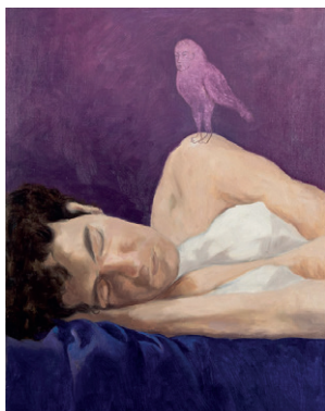
Valdrin Thaqi, Three views of secret, 2022 / eastcontemporary

Connessi con la vita e storia del Kosovo, i dipinti figurativi di Thaqi si ispirano a questioni filosofiche e morali, scaturite da eventi quotidiani, e tentano di analizzare la realtà sociale e