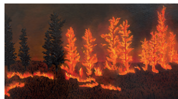
Jessie Homer French, Spreading Fire, 2022 / massimodecarlo