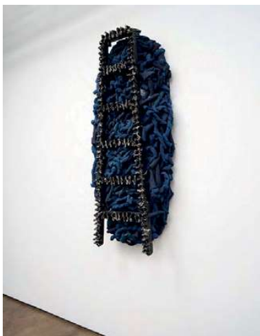
Nari Ward, Shield Wrung , 2023.