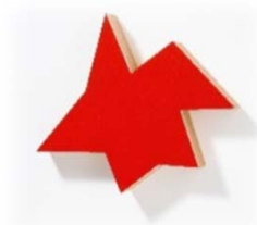
1994 Kinderstern 38,5x43x9 cm Acrylic on wood