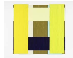
2016 Face 88 Ed. 36x36cm Acrylic on plastic foil