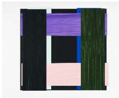
2016 Face 75 Ed. 36x36cm Acrylic on plastic foil