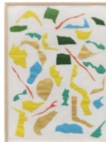
1977 Messerschnitt VI 100x70 cm Acrylic on paper