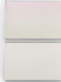
2006 Twin 4 144x99x6 cm Acrylic, aluminium, plastic film