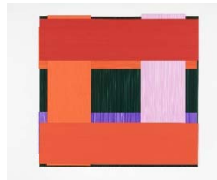
2016 Face 87 Ed. 36x36cm Acrylic on plastic foil