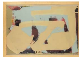
1983 Untitled 73,5x98 cm Enamel on layered