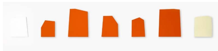
2012 Nummer 9B-15B 45,1x301,4x1 cm Acrylic on aluminium