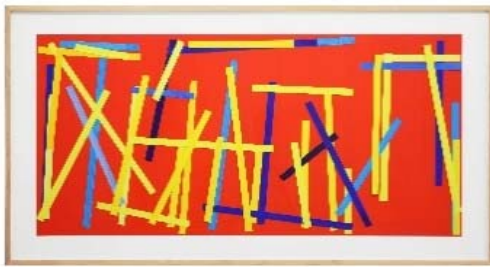
2007/ 2009 Fishing Red I E. 60x120 cm Acrylic on paper strips, collaged