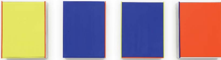
1994 DIN II A1-A4 36,7x132,5x8 cm Acrylic on aluminum on wood