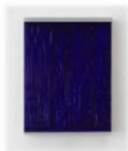
2016 Tafel DCCLXVII 19,6x14x3,5 cm Acrylic on aluminium, wood