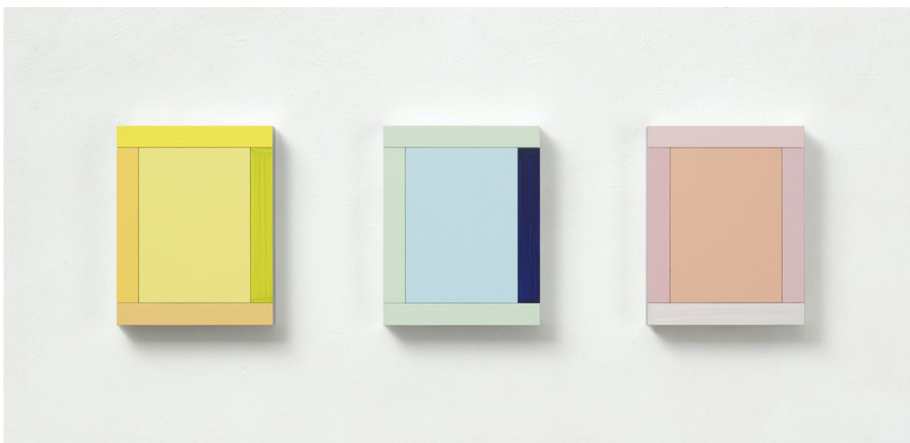
Imi Knoebel, Anima Mundi 106-3 , 2019, 37x127x5,8 cm.

Milano, settembre 2021 – Dep Art Gallery è lieta di annunciare la mostra Pittura Colore Spazio dedicata a Imi Knoebel (Dessau, 1940), tra i più noti artisti devoti al minimalismo e al costruttivismo, che dal 7 ottobre 2021 al 15 gennaio 2022 apre la nuova stagione espositiva della galleria.