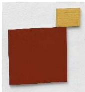
2018 Element 39.1 34,5x30,9x1 cm Acrylic on aluminium