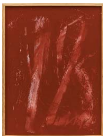
1990 Zeichnung 2 103x74 cm Reverse glass painting on plexiglass with lacquer