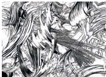
Jim Shaw, Untitled , 2017 / Massimo De Carlo

via Giovanni Ventura 5 – tel 02 70003987 www.massimodecarlo.it