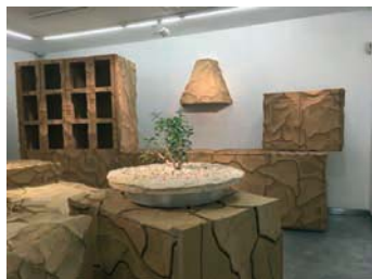
Gal Weinstein, Untitled , 2016, veduta dell'installazione / Galleria Riccardo Crespi

che all'abitare. Una volta uscite dallo studio dell'artista, le opere palesano la loro inadeguatezza ad essere agite, mostrando così la sostanziale separazione tra i significati sottili nella creazione di un'opera e la sua effettiva fruizione.