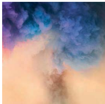
Goldshmiel & Chiari, Untitled view (part.) , 2017 / Renata Fabbri Arte Contemporanea

a cura di Gaspare Luigi Marcone fino al 6 maggio Il fumo, l'illusorietà, la sfocatura, la nebulosità – sviluppati con tecniche videofotografiche o installative – sono elementi presenti sin dall'inizio del sodalizio di Goldshmiel & Chiari. Da Renata Fabbri le artiste presentano una serie inedita di "specchi" di grande e medio formato. Fondamentali sono le variabili del doppio, dell'ambiguo e del complementare visto anche il loro essere una "coppia artistica".